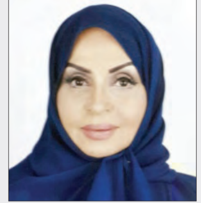
بقلم: د. نعيمة إبراهيم الغنم

رئيس مجلس خبراء تحرير صحيفة التزام عضو مجلس خبراء الشبكة الإقليمية للمسؤولية الاجتماعية