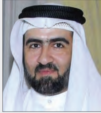
بقلم: د. عادل أحمد المرزوقي نائب رئيس مجلس إدارة الشبكة الإقليمية للمسؤولية الاجتماعية

فعندما نعبد الله تبارك وتعالى، نتذكر جميل عبادة النبي صلى الله عليه وسلم، وعندما نعامل الآخرين نستذكر خلق النبي صلى الله عليه وسلم في التعامل مع الآخرين، وعندما نكون في البيت نستذكر حاله صلى الله عليه وسلم مع أهل بيته، فهو القائل: (خيركم