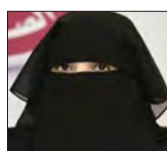
سعادة الشبيخة الدكتورة العنود بنت محمد آل ثاني المفوض الأممي للتشهير بأهداف الأمم المتحدة للتنمية المستدامة ٢٠٣٠ - المستشار العلمي للمؤتمر دولة قطر