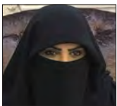
الدكتورة مريم الجميدي مستشارة دولية في تطبيقات الاستدامة - السفير الأممي للشراكة المجتمعية رئيسة المؤتمر - دولة قطر