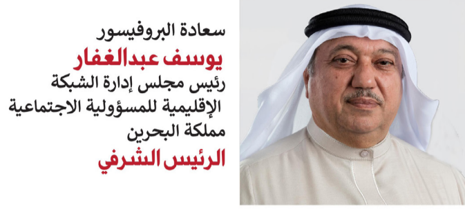
سعادة البروفيسور يوسف عبدالغفار رئيس مجلس إدارة الشبكة الإقليمية للمسؤولية الاجتماعية مملكة البحرين الرئيس الشرفي