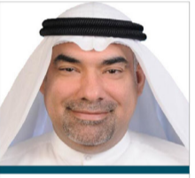
سعادة الدكتور عبدالعزیز التري خبير اقتصادي السفير الأممي للشراكة المجتمعية دولة الكويت