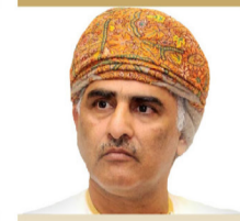
المكرم الشيخ حاتم الطائي رئيس تحرير صحيفة الرؤية السفير الدولي للمسؤولية الاجتماعية - سلطنة عمان ضيف شرف