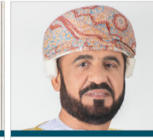
سعادة الدكتور حامد البلوشي مدير عام شبكة الباحثين العرب في مجال المسؤولية الاجتماعية سلطنة عمان