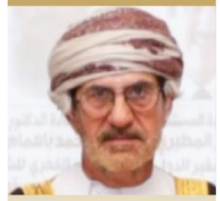
المكرم الشيخ علي بن ناصر المحروقي السفير الدولي للمسؤولية الاجتماعية سلطنة عمان ضيف شرف