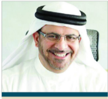
سعادة البروفيسور علي آل إبراهيم نائب رئيس مجلس إدارة الشبكة الإقليمية للمسؤولية الاجتماعية دولة قطر رئيس اللجنة العلمية للمؤتمر