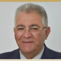
سعادة الأستاذ الدكتور عماد أبوكنتك رئيس جامعة القدس دولة فلسطين ضيف شرف