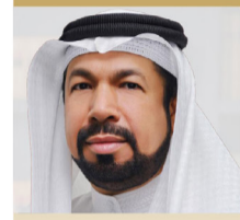
سعادة الدكتور صلاح بن علي عبدالرحمن وزير وبرلمان سابق السفير الدولي للمسؤولية الاجتماعية - مملكة البحرين ضيف شرف