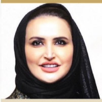
سعادة الشيخة سهيلة فهد المالك الصباح العضو الشرفي للصندوق العربي لرعاية بحوث المسؤولية الاجتماعية ضيف شرف