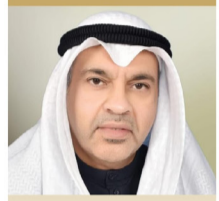
سعادة الدكتور شهاب أحمد العثمان رئيس برنامج الكويت للمسؤولية الاجتماعية دولة الكويت رئيس اللجنة المنظمة العليا