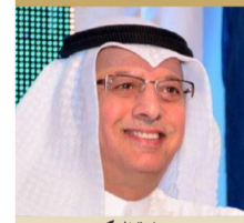
سعادة الدكتور بدر عثمان مال الله خبير اقتصادي السفير الدولي للمسؤولية الاجتماعية دولة الكويت ضيف شرف